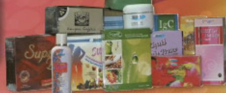
Cadangan Set Kehamilan Biodex

Dengan ini kami ingin mengucapkan jutaan terima kasih kepada Dr Hajjah Siti Murni kerana telah memformulakan rangkaian pemakanan lengkap yang dapat membantu saya untuk hamil dengan mudah dengan izinNya. Bersyukur kepada Allah swt kerana kini hidup saya dan suami semakin lengkap dengan kehadiran cahayamata yang memberi sinar baru dalam hidup kami. Kepada anda yang masih menanti untuk mendapatkan zuriat, cubalah rangkaian produk BIODEX kerana dengan izin Tuhan, ia pasti akan memberikan kesan yang memuaskan.